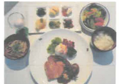
内子産伊予牛のロースト

☆食材は季節により変わることがあります。 ☆団体様の受付は10名以上とさせていただきます。 ☆メニューは一つに統一させていただきます。 ☆添乗員・乗務員の料金は600円+税とさせていただきます。その際、現金でお願いします。 ☆クーポンのご利用もできます。尚、クーポンのご利用は税別20,000円以上とさせていただきます。 税込み21,600円以下は現金でお願い致します。 ☆キャンセル料は前日の午前中にご連絡いただいた場合には無料です。 当日の天候によるキャンセルについては、半額いただきます。 その他の理由によるキャンセルにつきましては、全額いただきます。 ☆その他、ご不明な点につきましては、レストランまでご連絡下さい。