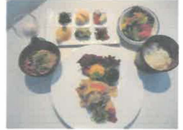
内子豚の焼しゃぶ