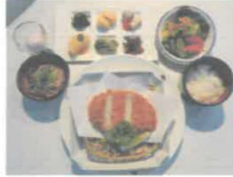
内子豚のロースカツ