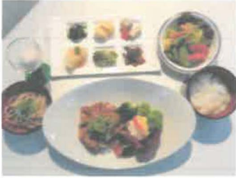
内子豚のもろみ焼