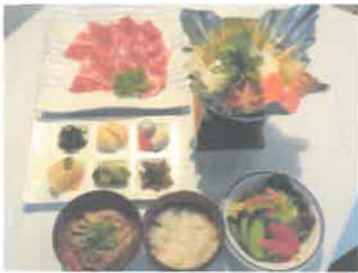
内子豚のしゃぶしゃぶ