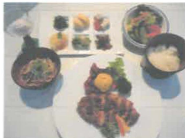
内子産伊予牛のもろみ焼